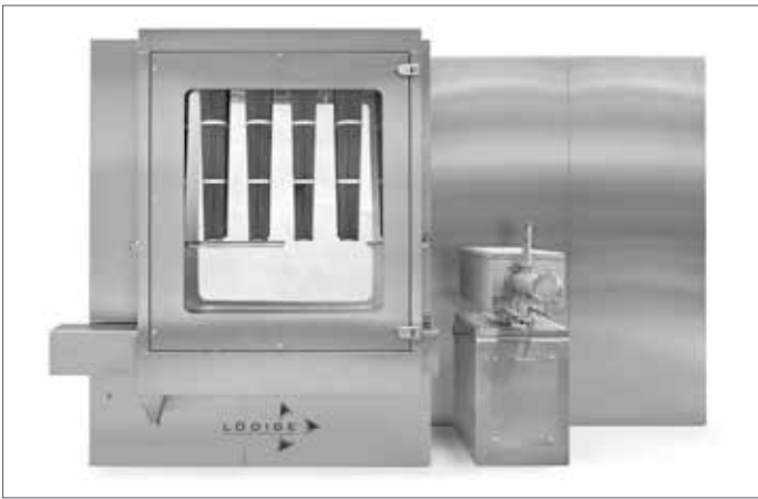
GRANUCON® LCF 5 / CM 5