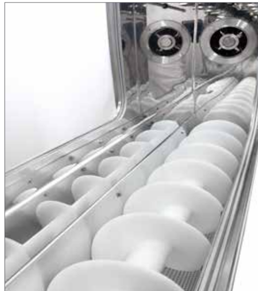
Schnecke im Wirbelschichttrockner